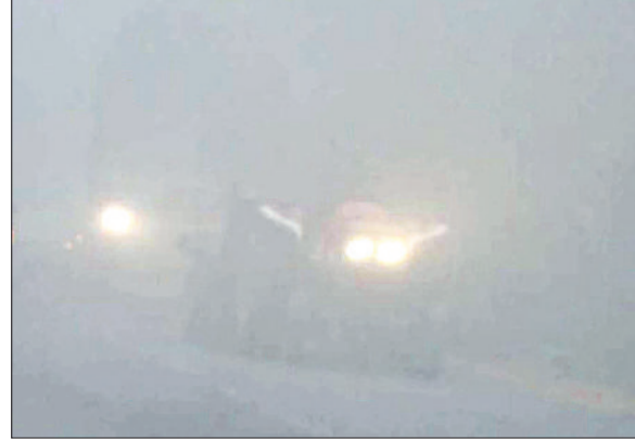
यमुनानगर। मंगलवार को सुबह के वक्त घने कोहरे के बीच सड़कों पर रंगते वाहन।

मंगलवार अलसुबह तीन बजे से ही जिले में घना कोहरा छा गया था और शीतलहर चल रही थी। वहीं, दोपहर एक बजे तक आसमान में धुंध के बादल छाए रहे और शीतलहर चलने से मौसम में हाड़तोड़ ठंड बनी रही। दोपहर एक बजे के बाद किसी तरह