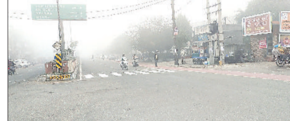
कुरुक्षेत्र। आसमान में छाई कोहरे की चादर।