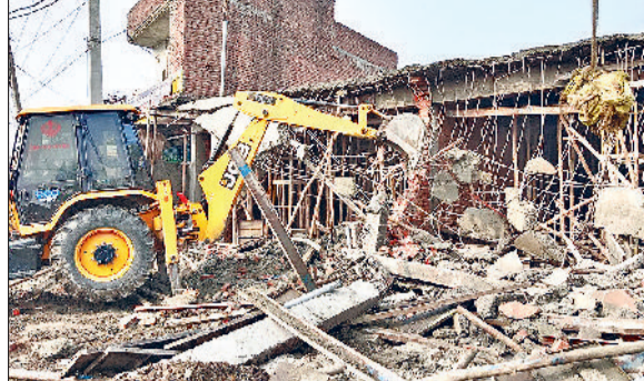
इंदी। गांव मटकमाजरी के पास बन रहे निर्माणाधीन शोरूमों पर चलता पीला पंजा।